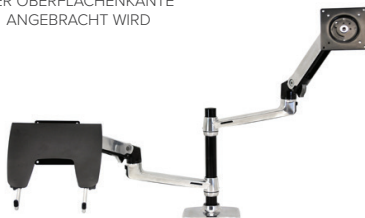
DAS GEZEIGTE NOTEBOOK-ABLAGE-KIT WIRD STANDARDMÄSSIG MIT DEM DUAL GESTAPELTEN POLIERTEN ALUMINIUMARM #45-248-026 MITGELIEFERT

BEI DEN WEISSEN DUALEN LX ARMEN KANN DAS NOTEBOOK-ABLAGE-KIT #50-193-200 (NUR SCHWARZ) SEPARAT BESTELLT WERDEN