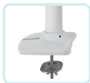
ZUBEHÖR FÜR WEISSES HALTERUNGSKIT 98-083 MIT KABELDURCHFÜHRUNG: WIRD DURCH EINE OBERFLÄCHENÖFFNUNG ANGEBRACHT