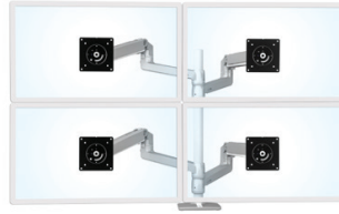
ABGEBILDET MIT EINEM LX-ARM, EINER VERLÄNGERUNG UND FASSUNGSSÄTZEN FÜR VIER BILDSCHIRME