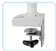
ZUM DUAL GESTAPELTEN LX-ARM ENTHALTEN: 2-TEILIGE STANDARD-TISCHKLEMME, DIE AN DER OBERFLÄCHENKANTE ANGEBRACHT WIRD