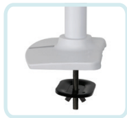
DIE HALTERUNG MIT KABELDURCHFÜHRUNG, DIE DURCH EINE OBERFLÄCHENÖFFNUNG ANGEBRACHT WIRD