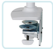
ZUM DUAL GESTAPELTEN LX-ARM MIT HOHEM PFAHL GEHÖREN: EINE ZWEITEILIGE HEAVY-DUTY-TISCHKLEMME, DIE AN DER OBERFLÄCHENKANTE ANGEBRACHT WIRD